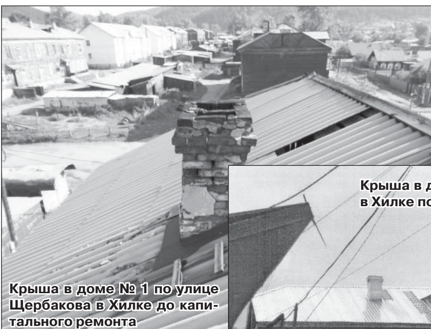
Крыша в доме № 1 по улице Щербакова в Хилке до капитального ремонта

Осталось совсем немного времени до окончания работ и в городе Хилке, где в этом году проходят работы по ремонту крыш на восьми