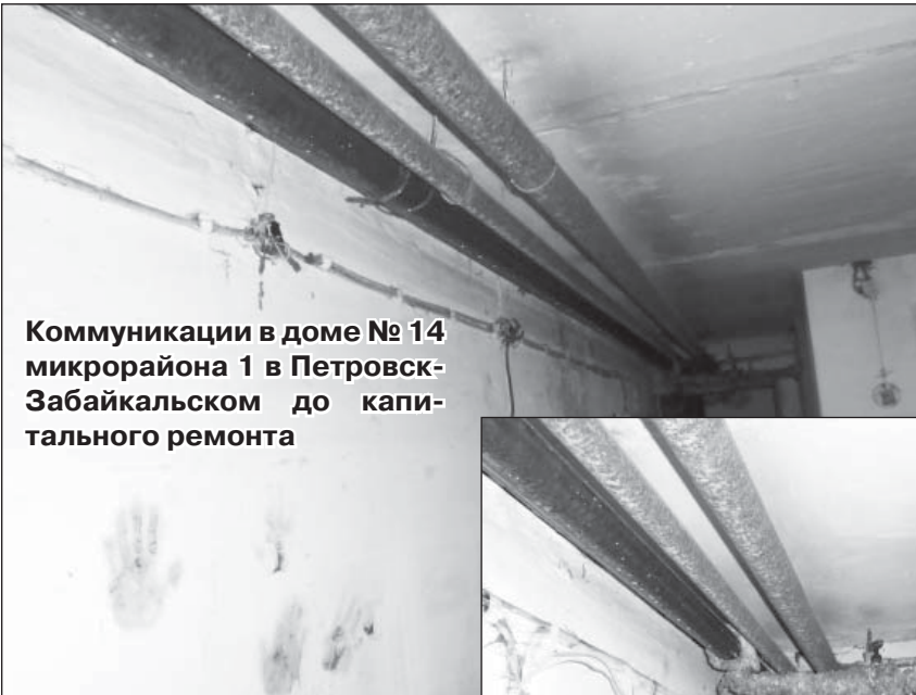
Коммуникации в доме № 14 микрорайона 1 в Петровск-Забайкальском до капитального ремонта

В городе Петровск-Забайкальском ремонты внутридомовых ин-